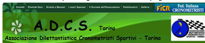
home page del sito cronotorino.it

Una volta organizzatori e concorrenti chiedevano dove poter vedere o scaricare le classifiche ora arrivano con tablet e smartphone gia' connessi sulla pagina dedicata alla gara.